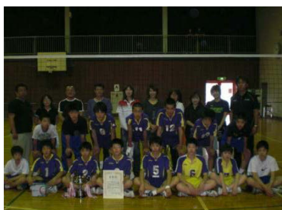
優勝 富士見市東中学校