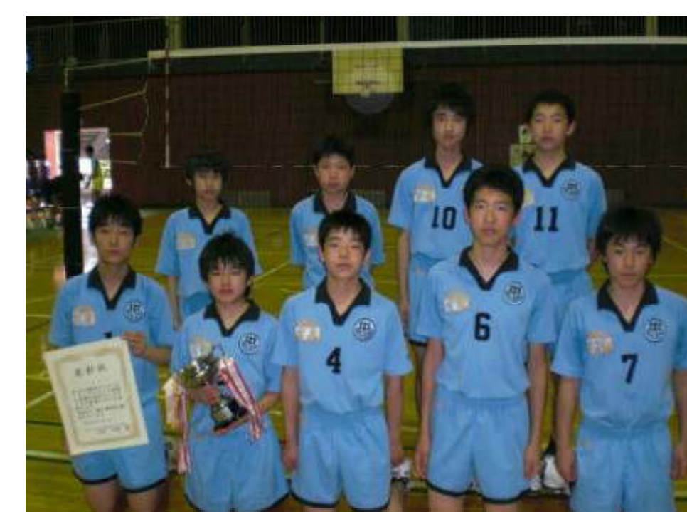
第3位 さいたま市立宮原中学校