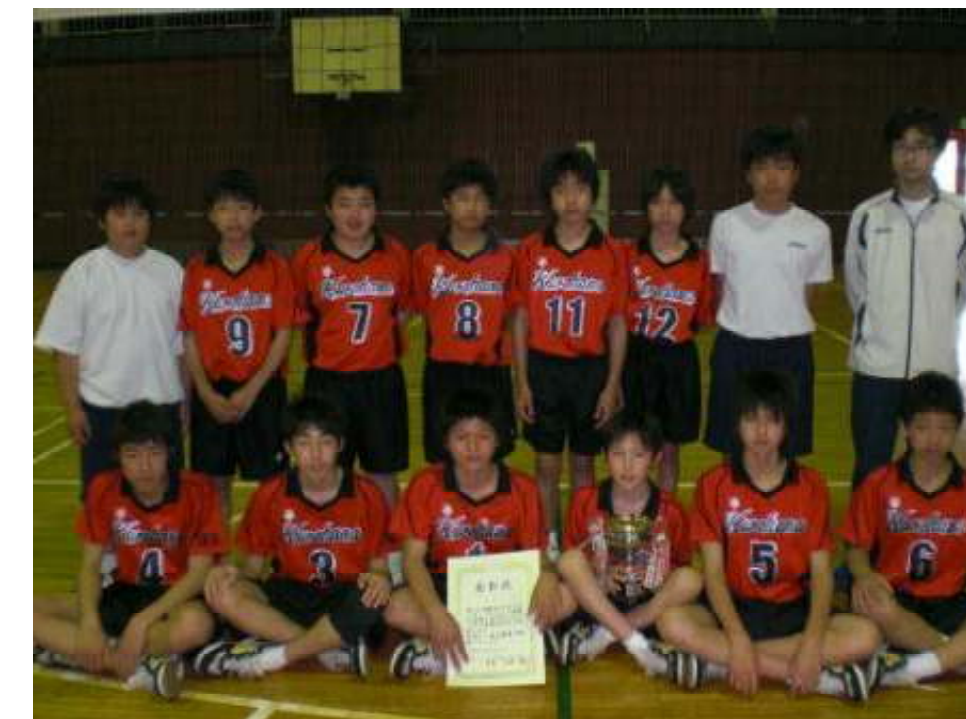
第3位 蓮田市立黒浜中学校