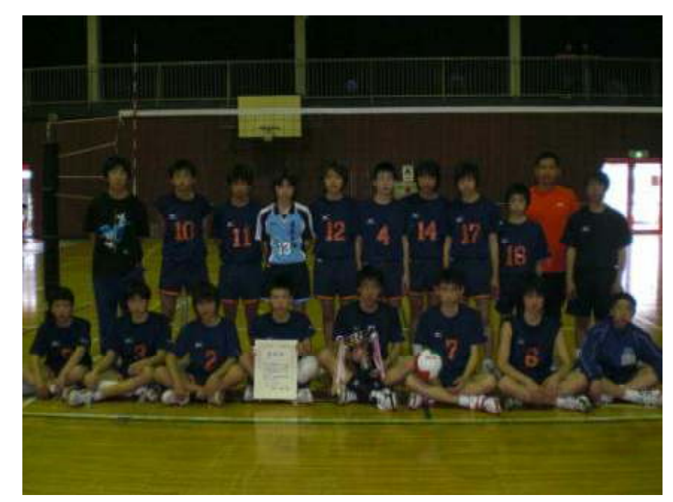
準優勝 春日部市立緑中学校