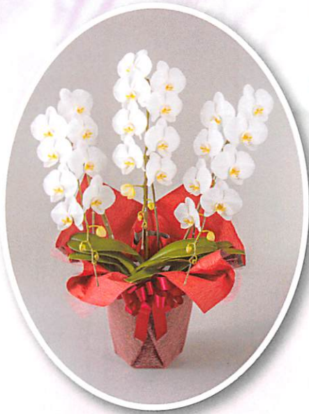
白大輪 3本立 ¥18,000 (税別)