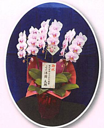
ミディーコチョウラン ¥9,000 (税別)

発送も承ります (送料別) 宅急便 サイズ ¥2,500 ~ ヤマト便 サイズ ¥3,500 ~ ※宇都宮市内お届けサービス ¥1,000